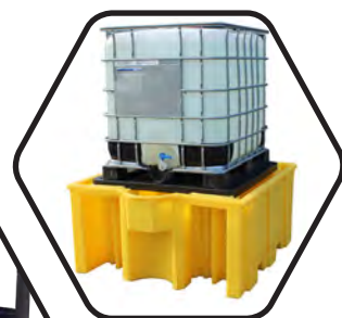
Модель с дополнительной решёткой (ВВ3G)

Внимание! Поддоны следует перемещать только пустыми!